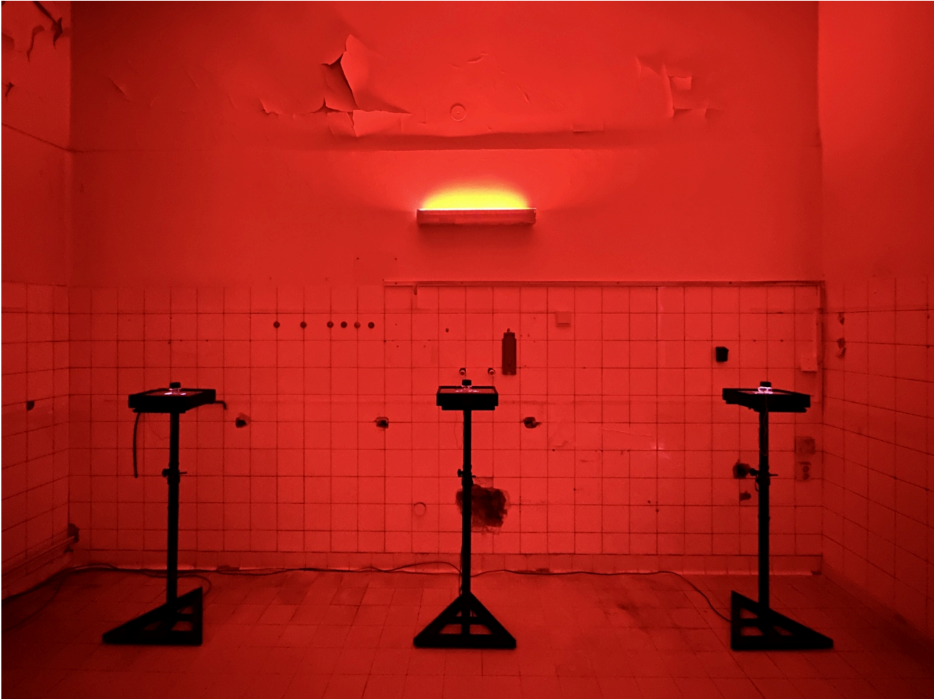
Studies of Change, Bremen.