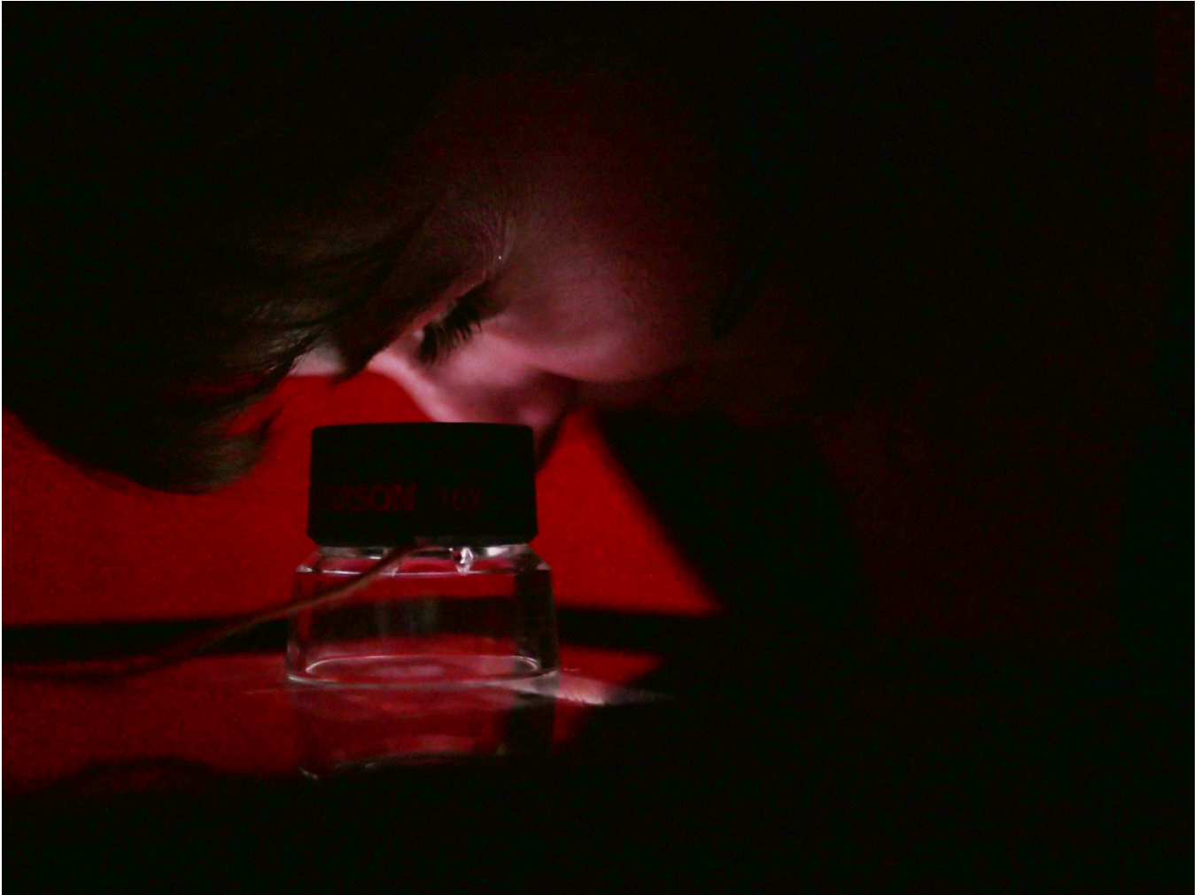
Studies of Change, Bremen.